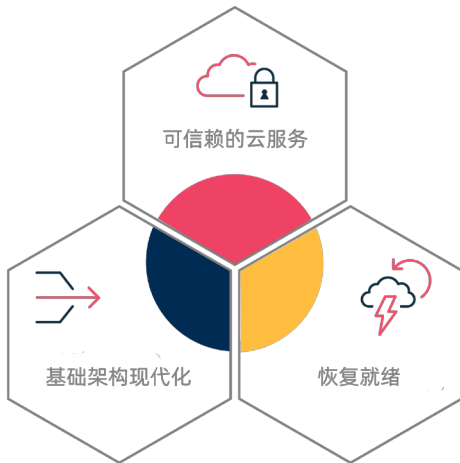
图 1：全面数据管理的目标

云环境为存储和计算提供了独特、敏捷且经济有效的基础架构。然而，要实现它的所有优势，您必须使用可信赖的云服务。明确您的目标，针对数据迁移之前和之后的数据可移植性和保护做出明智的选择，然后准备并暂存您的数据以实现最终目标。