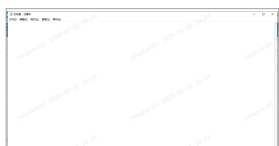
屏幕明文水印效果